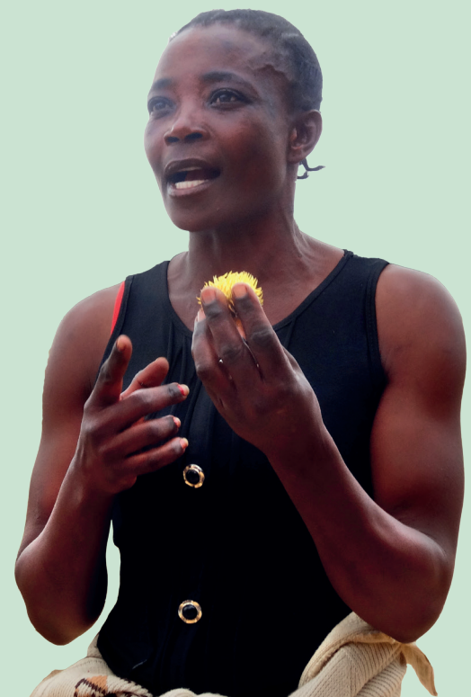
Für das Sammeln von 50 Kilo dieser Wild-Nüsse erhält eine Arbeiterin 50 Ngwee, also etwa 5 Cent

Abschließend dokumentierten wir die makaber niedrige Bezahlung von Gelegenheitsarbeit auf der Agrivision -Farm. Die Arbeit besteht darin, Wild-Nüsse zu sammeln, die für die maschinelle Sojaernte ein Problem darstellen. Das Sammeln eines 50-Kilo-Sacks wird mit umgerechnet 5 Cent entlohnt, erzählen die DorfbewohnerInnen.