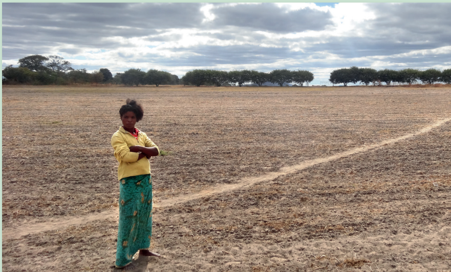
Eine Slumbewohnerin zeigt uns ihr ehemaliges Ackerland. „Das Land wurde uns weggenommen. Nun ist es schwierig an Essen zu kommen. Wir wollen den Boden bewirtschaften, damit unsere Kinder satt werden und nicht stehlen gehen.“

Und es kommt noch schlimmer: zwei Tage später waren Bulldozer angekündigt. Die BewohnerInnen sollten bis dahin an einen anderen Ort verschwinden. Wir haben umgehend Kontakt mit der Bahngesellschaft und der Provinzregierung aufgenommen und konnten zumindest einen Aufschub der gewaltsamen Räumung erreichen. Auch haben wir die deutsche Botschaft und das BMZ informiert und zum dringenden Handeln aufgerufen. Weitere Arbeit steht an.